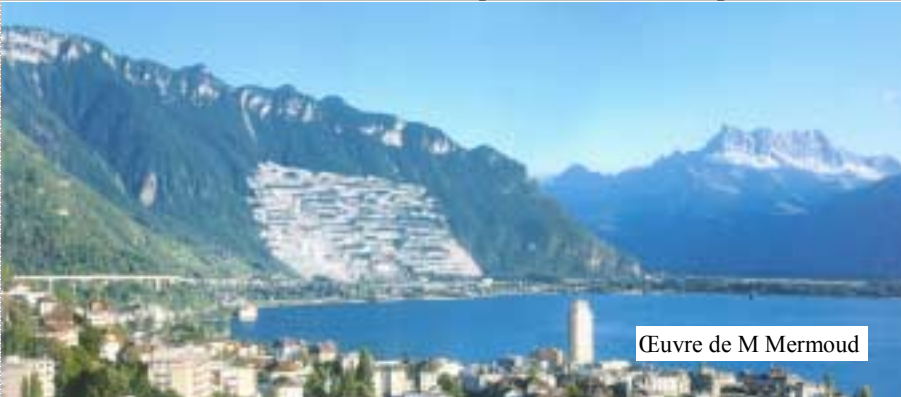
Œuvre de M Mermoud

Le rectangle d'Arvel (ci-dessous en 2009) n'a plus rien à envier au triangle des Bermudes. En effet, c'est en Arvel que tout bon sens disparaît.